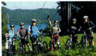
青木湖でのクリニック

カナディアン・ロックな指導や、親切なアドバイスで有名なカナダのアルイスを受け、数々のレーパータ州出身。MTBをスに登場。平成6年には、始めるきっかけは大学の大小18戦に出場し、わず時。小学生から続けていか1年で「エリートライタサッカーの試合中、ジター」と呼ばれるクラス帯の3分の2を切断するに昇格します。